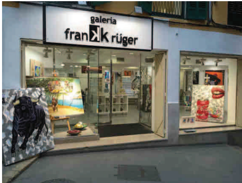
Mitten in Palmas Altstadt liegt eine der zwei Galerien auf der Insel. In the heart of Palma's old town is one of the two galleries.

Galeria Frank Krüger has become a point of interest for art lovers. Celebrities love the colourful and expressive works